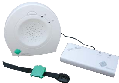
L'ensemble Safety Turtle comprenant la batterie autonome.

Les Tortues sont disponibles en cinq couleurs vives. Chacune d'elles est associée à une fiche de même couleur (Baby Turtle) qui s'insère dans le coin inférieur gauche de la base-réceptrice, comme on le voit ci-dessous.